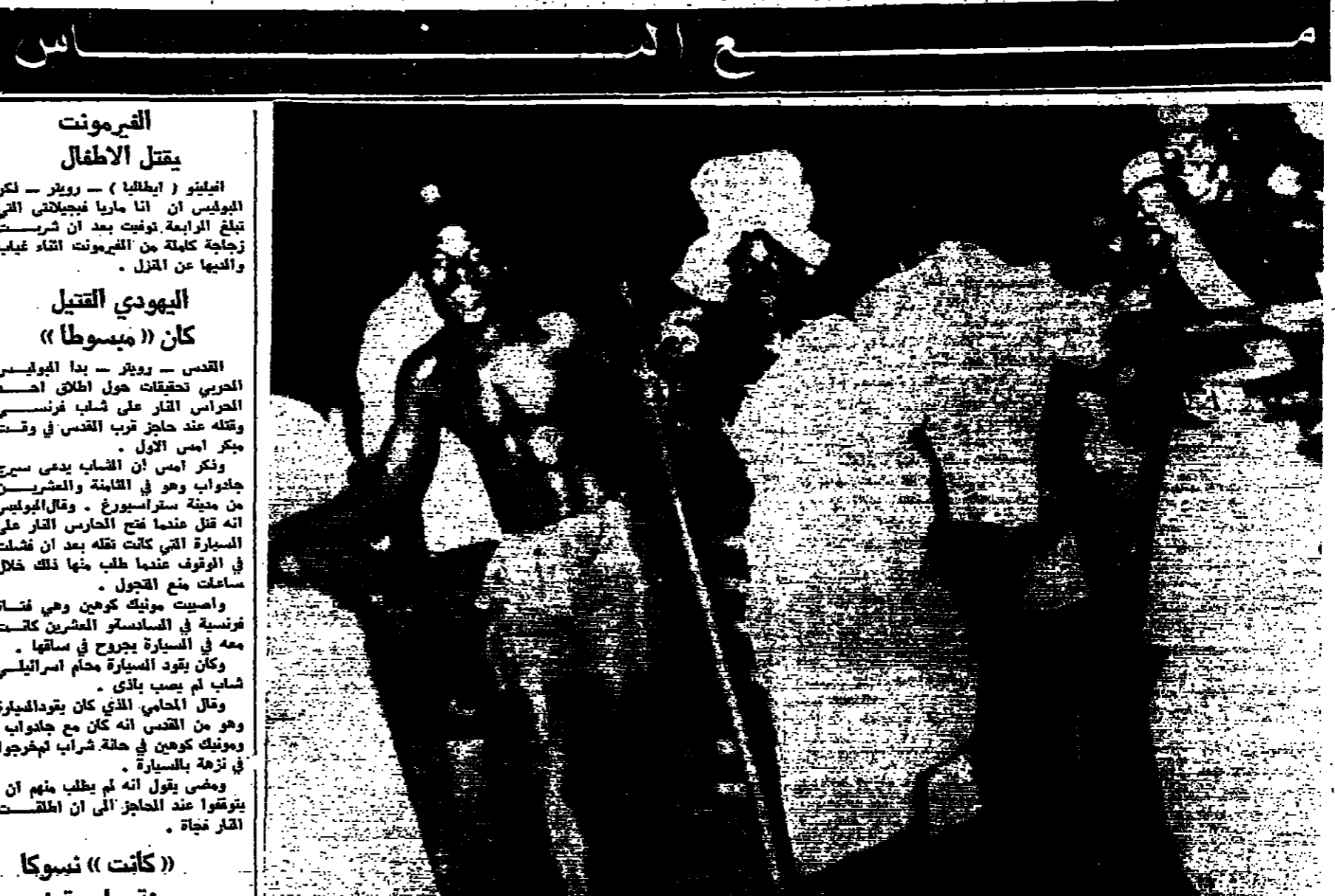
القتل والقول، أو المناظر والصور يرقصان أمام الجماهير في العاصمة غانا... وفي اليوم الأحد تجمع الناس وطعنوا كوكا سبيكو صوبيل بسكين يسدا...